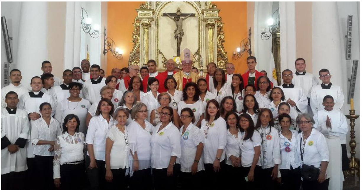
Ministros y Servidores de la Caridad instituidos el 30 de junio de 2018.